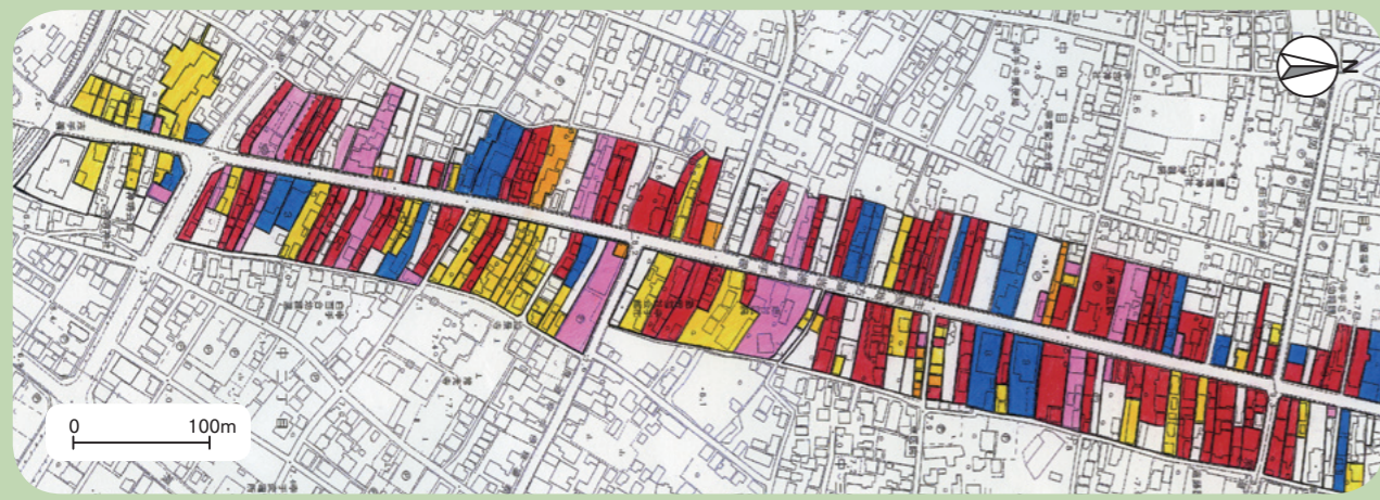
図1 旧日光街道沿線のおもな土地利用(2008年) 基図:幸手市発行2,500分の1「幸手市地形図12」(2002年測量)