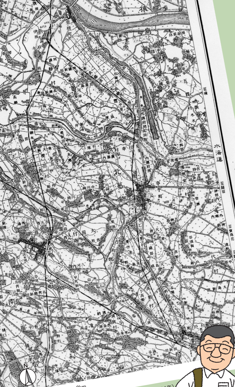
図2 東武鉄道日光線開通当時の幸手町周辺を示す地形図(1934年)